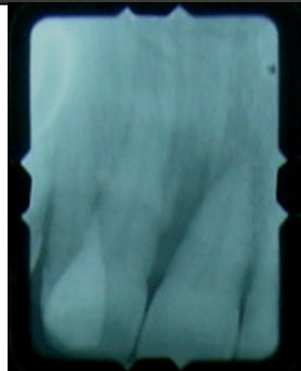
Lyse alvéolaire angulaire du 1/3 apical en mésial de la 21