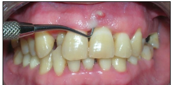
Vue vestibulaire montrant une fistule en regard de la 21